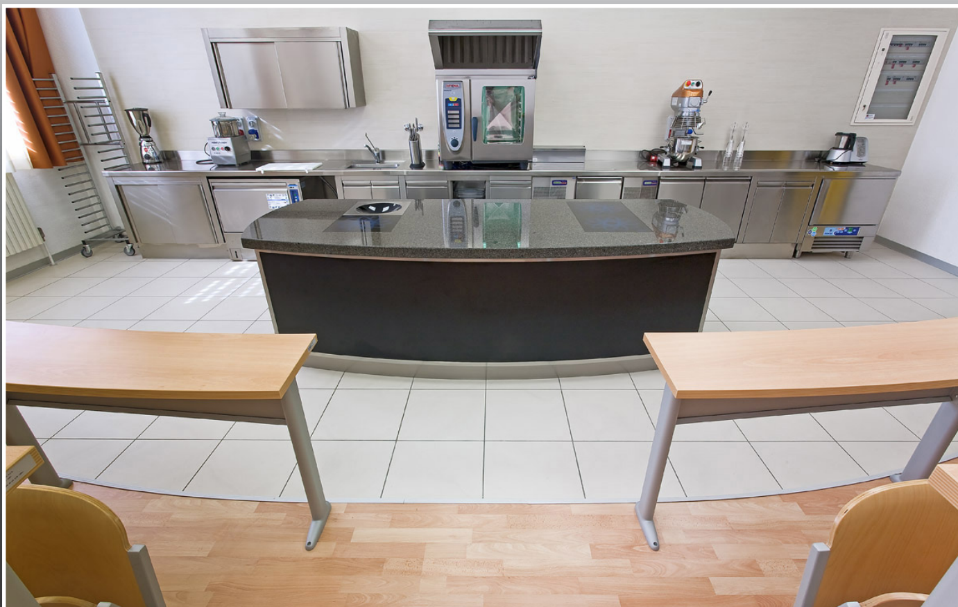
Istituto di Formazione Alberghiero C.F.P. - Scuola di Alta Formazione Tione (TN)