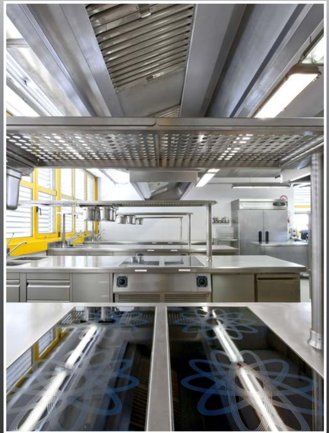
Istituto di Formazione Alberghiero C.F.P. Tione (TN)