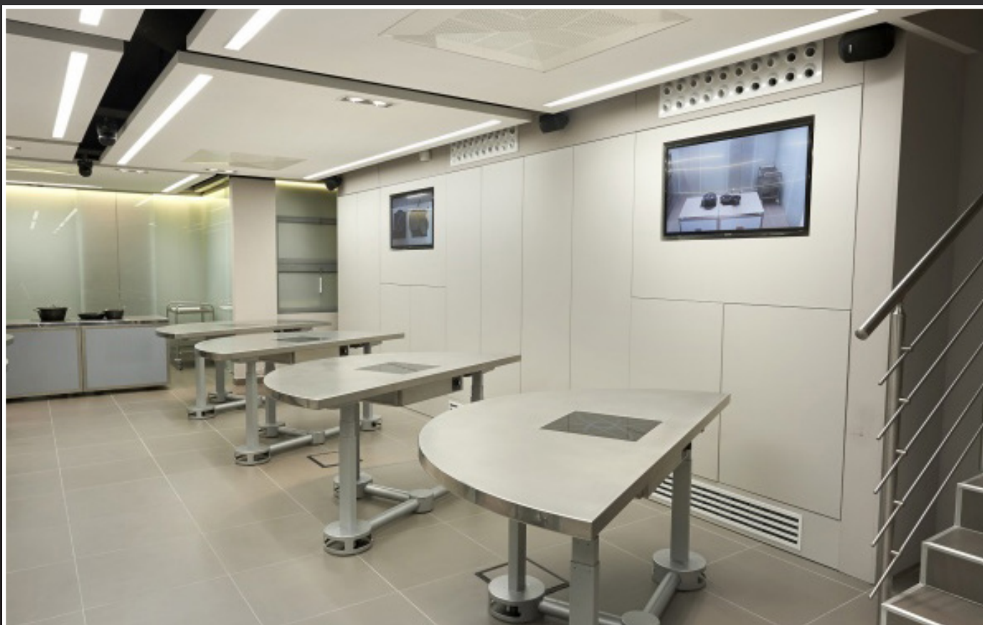
Scuola Arte del Convivio (Identità Golose) Milano (MI)