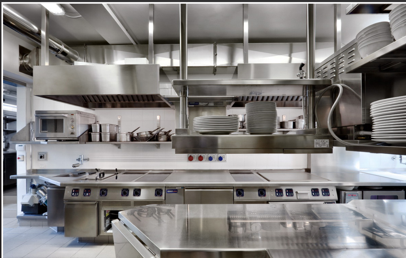
Ristorante La Terrazza Torbole sul Garda (TN)