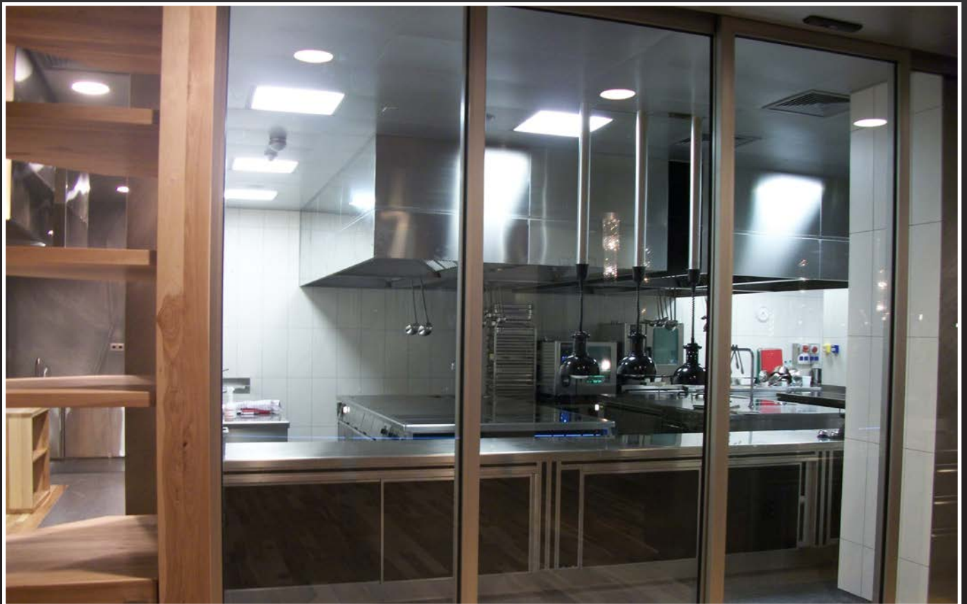
Wolf Restaurant Varsavia (POLONIA)