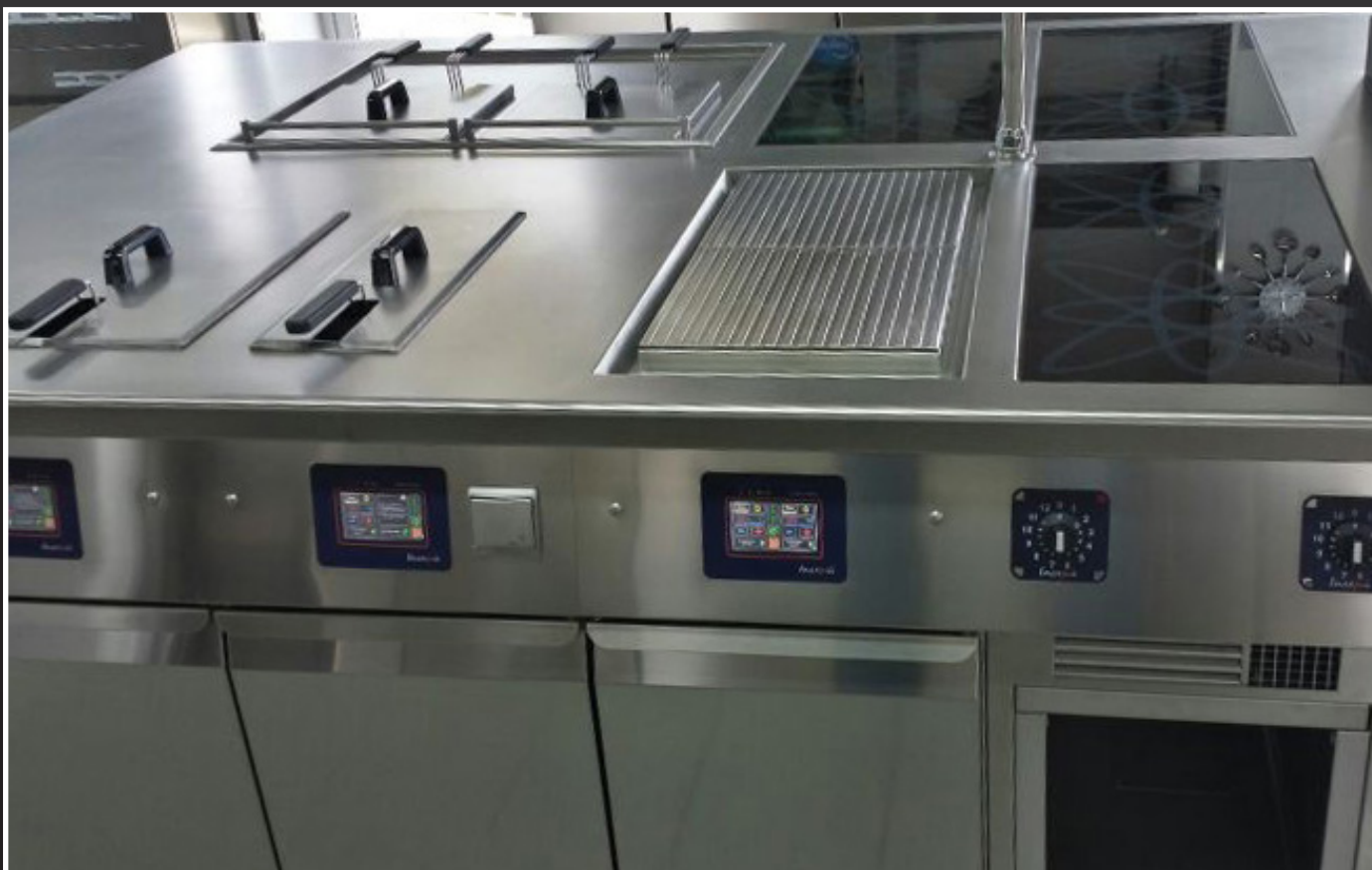
Villa Tiziana *** Marina di massa (MS)