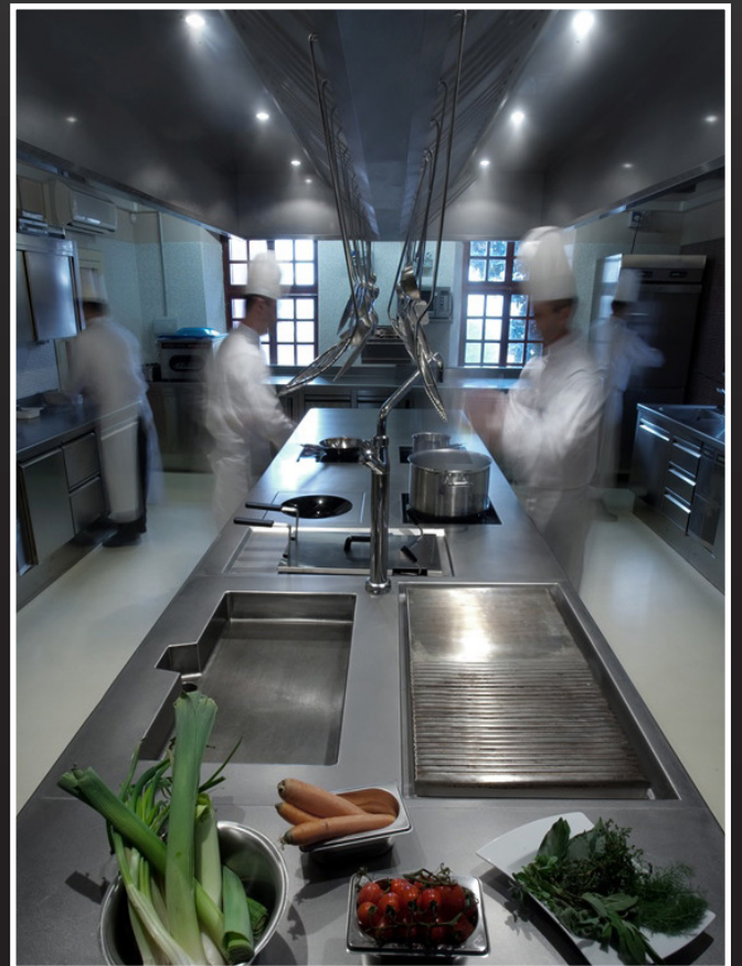
IFSE Italian Culinary Institute Piobesi Torinese (TO)