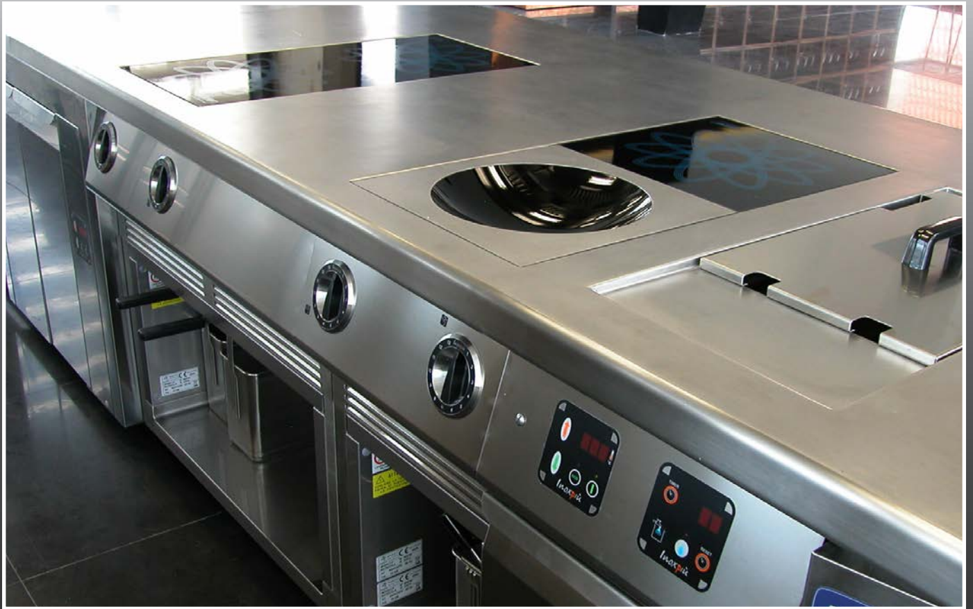
The Acquario Restaurant Wroclaw (POLONIA)