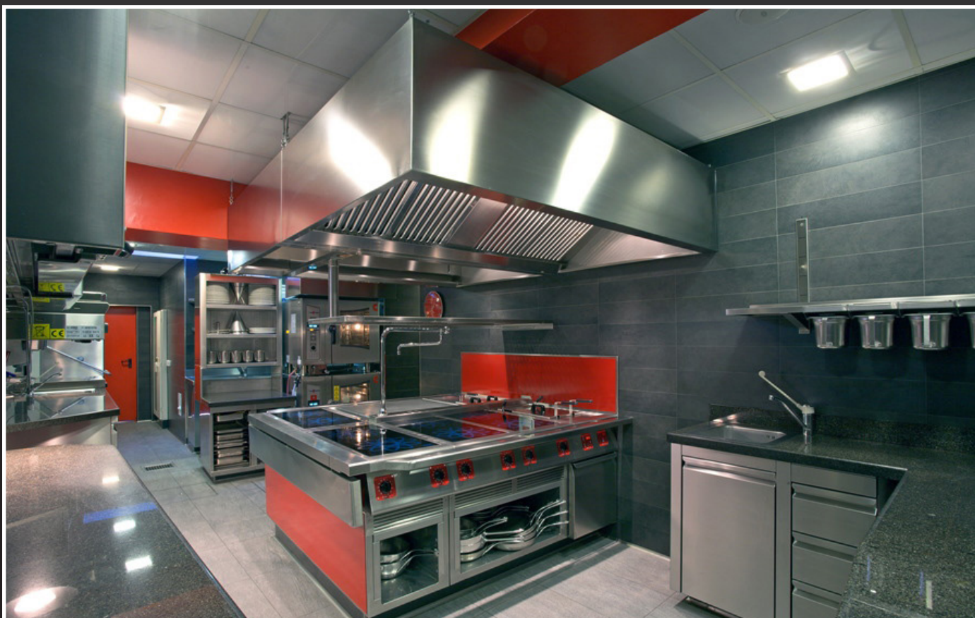
Ristorante Vitello D'Oro (Cucina Gourmet) Udine (UD)